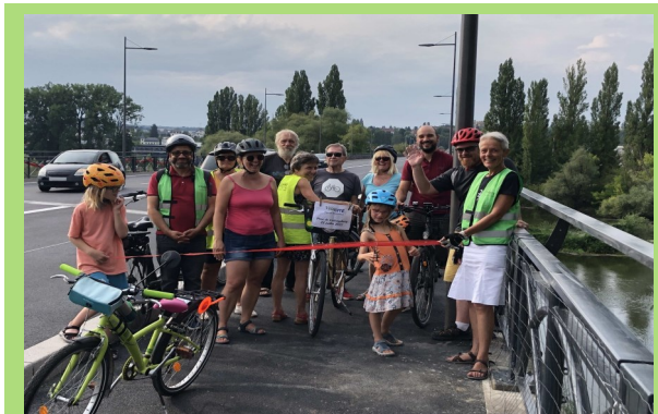
Inauguration « en grandes pompes » de la nouvelle voie partagée

Une voie partagée de 2,50 m a été installée sur le pont, côté usine Stellantis.