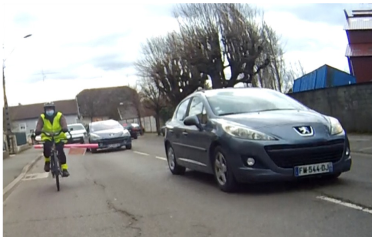
Les frites de piscine poussent les automobilistes à s'écarter des cyclistes.